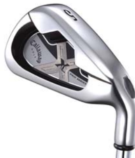
X-18 Pro Series Irons