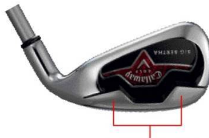
ニュー・ノッチ・ウェイトイング・システム