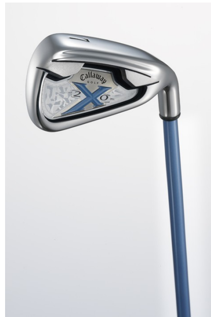
Ladies Model Design