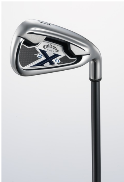
Men's Model Design